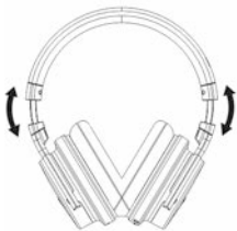
Регулиране на дължината