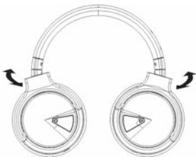
Регулиране на ъгъла