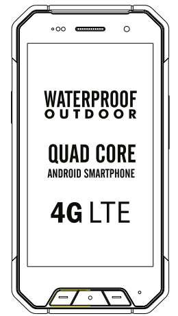
EVOLVEO StrongPhone Q7 LTE